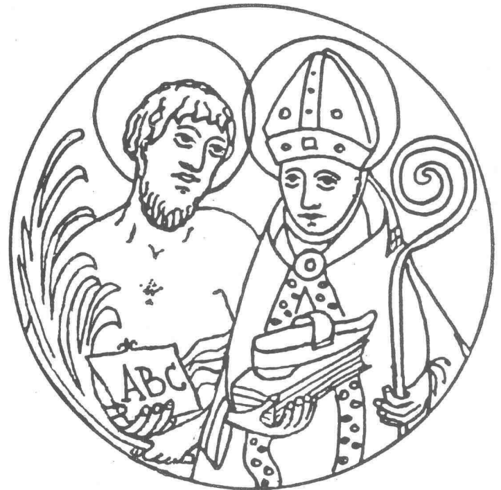
I santi martiri Cassiano e Vigilio, patroni della Diocesi