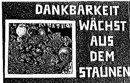
Unser Vorhäng für den Schatzraum

PLATA DLA CÛRA n. 21 dal 15-10 al 28-10-2012