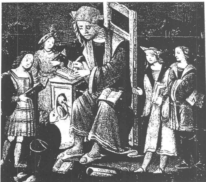
CASSIANO di Imola. Amico Aspertini, C. fa scuola . Milano, Pinacoteca di Brera (sec. XV).

Con la Sua firma sulla dichiarazione dei redditi o sul mod. CUD può destinare l' 8xmille alla Chiesa Cattolica . La Chiesa con i proventi dell'8xmille può finanziare molto: sostentamento del Clero, attività pastorali in Diocesi, contributi per risanamenti e costruzioni nelle parrocchie, Caritas, Missionari, progetti di formazione e di aiuto nel terzo mondo ed altri.