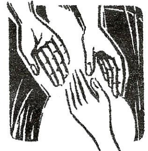
ressorí le terzo dé a vita nòia