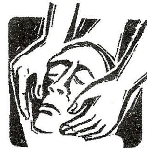
sopolí sciöche n mort