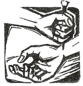
castié sciöche n malfatur