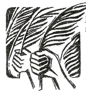
Festejé sciöche n Re