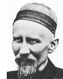
Sant'Ujöp da Oies * 15.04.1852 + 28.01.1908

Periun! Signur, nosc Dio, to Spirit Sant á sbürlé sant Ujöp Freinademetz a jí a ti encündé le vangelo ai pagans. Por sōa interzesciun te periunse, fá che düc i popui empari da conesce le der salvatur y ti mantegni la fedelté. Do cōsc te periunse por nosc Signur Gejú Crist, to Fi, co é Dio y vir y regneia con te tl'unité dal Spirit Sant por düc i secui dai secui. – Amen.