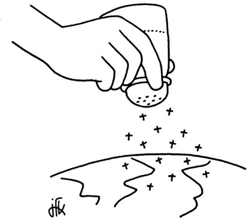
Os seis le se dla tera.

☞ Letöres dla 6. domegna ia por l'ann: Sir 15, 15–20 | 1 Cor 2, 6–10 | Mt 5, 17–37