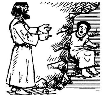
Lázarus, ví fora! Jan 11, 43

[...] 17 Canche Gejú ea roé danló, ál ciagé Lázarus co ea belo cater dis te fossa. 18 Betania ea dampró da lerúsalem, encer chinesc stadi dainciará. 19 Trec iüdes ea gnüs da Marta y Maria a les consolé por so fre. 20 Canche Marta á aldí che Gejú ea tal gní, ti éra jüda adancuntra, mo Maria ea romagnüda te ciasa. 21 Marta ti á dit a Gejú: Signur, sce te fosses sté atló, ne foss mio fre nia mort. 22 Mo ince sen sai: Döt, do ci che te preies l'idio, él el co te dará. 23 Gejú ti á dit: To fre ressoziará. 24 Marta ti á dit: I sa ch'al ressoziará dala ressozeziun l'ultimo de. 25 Gejú ti á respognü: lu sun la ressozeziun y la vita. Chel co crei te me viará, ince sc'al mör, 26 y vignönn co vir y crei te me, ne moriará mai. Creieste tö cösc? 27 Marta ti á respognü: Sce, Signur, i creii che tö es le Messia, le Fi de Dio, co dess gní te cösc monn. [...]