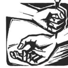
Du wirst gebrochen.