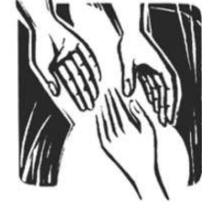
In dir werden wir alle ganz.