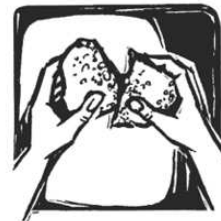
Du brichst das Brot mit uns.

Der wahre Weg ist der, den ich annehme als den meinen und mit Haltung und Tapferkeit auch dann zu gehen versuche, wenn es nicht mein liebster Weg sei sollte.