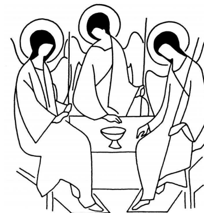
Icona dla Trinité de Roublev

I podun dí l'esenzial de nosta fede cristiana con ponsiers cörc: "Chelbeldio é amur. Porchel messunse ince nos s'orei bun önn al'ater". Se stontamo forsc porchel tan trepa jont da ti jí pormez a Chelbeldio, deach'i lasciun odei massa püch so amur? Va mo porchel le cristianejim te trec posc zoruch, deache cösta verité é gnüda desmonciada? Le Spirit Sant ô entrés endó se condü te che sora verité: Chelbeldio é amur, porchel messunse ince nos s'orei bun önn al ater.