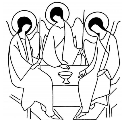
Icona dla Trinité de Roublev

Beldio tla Trinité, tö t'as manifesté a nos. Fá ch'i odunse ete, che pa te sunse al sogü y fá ch'i romagnunse dagnora unís a te, che te vires y regneies t'l'eternité.