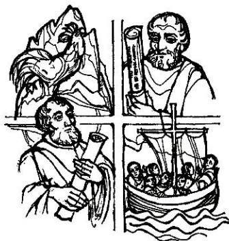
SAN PIRE Y SAN PAUL

Scinché tēmp: la Ciasa de Palsa Ojöp Frëinademetz chir renforz por le grup volontar: porsones de vigni eté che á ligrēza da se dé jö cun jënt atēmpada y ti mēt a desposiziun n pū’ de so tēmp por chēstes ativités: jí a spazier, se la cunté cun ēi, ti sté dlungia canche ai é pūri, ti lí dant val’, cianté, soné, carté, fá jüc,... Ince sce valgügn ne á nia tröp tēmp, é la regolarité dēr importanta por cíafé n raport de confidēnza cun les mēdes y i berbesc. Bēgnodūs é ince mituns, joggn, ciantarins, musicontri y atri grups o uniuns. De cōr dilan ai/les volontars/es che á fat o fej dōtaurela chēsc sorvisc dēr de valūta y aprijé te Ciasa de Palsa! Por informaziuns contaté la CdP al nr. de tel. 0474-524700 (damané do Gitti o Albina).