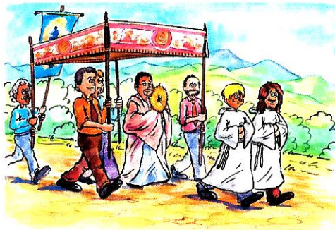
Gratis Download in hoher Auflösung ohne Wasserzeichen auf: AGNES AVAGYAN Free high resolution file without watermark available at: www.Live-Karikaturen.ch

Incö, festa dles Antlès, aldiunse l vangele dla multiplicaziun di pans c di pësc. Chēsc me recorda che l'Eucarestia n'arjunj nia so travert, sce ala se destol dai bujègns dles porsones. An ne pò nia festejé Les Antlès y tl medemo tēmp lascé susc i püri bhe à debujègn, chic he n'è nia na ciasa, i profugs, i foresti, i desperà, i dmarà. Ci che se detlarèia publicamēnter sön la pert de Gejü Crist, mëss ince Dauri so cör pur chi che patësc y pur i debli. Avisa sciöche Gejü à fat. Ch che tol pert ala Comuniun, mëss ince ster intësc arjignà Da partì – anfat olache al va debujègn. Sce Gejü Crist é l zēnter de chēsta festa, spo mëssel varèi ci che è instëss à vit danfora con so ejēmpl.