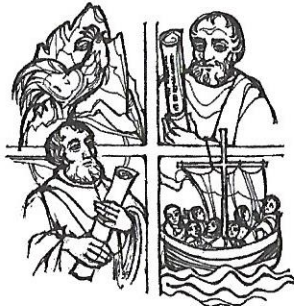
Petrus und Paulus

8 %o ala dljia catolica: cun na firma sön osta "denuncia dei redditi" o mod. CU podëise destiné l'8 %o ala dljia catolica. Implö podëise sostení cun le 5 %o val'atra organisaziun catolica o sozuala. Chi che ne fej nia la detlaraziun ciafa te calonia n formular da scrí fora.