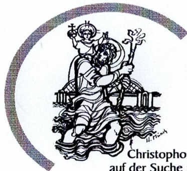
Christophorus - auf der Suche nach dem Größten, sei unser Weggefährte auf der Suche nach Gott!

Mostra: l'Istitut Ladin "Micurá de Rù" Ves invieia dër bel ala daurida dla mostra de Matthias Sieff, en vëndres, ai 22 de lugio dales 18:00 tl salff dl Istitut Ladin a San Martin. La mostra é daverta: dai 23.07. ai 07.08.2022 dales 10:00 - 12:00 / 15:00 - 19:00.