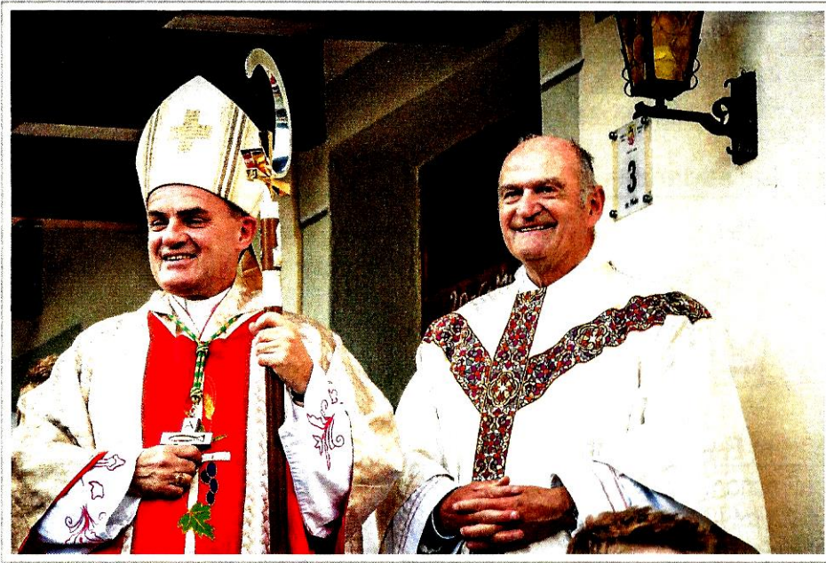
GIULAN A DÜC!