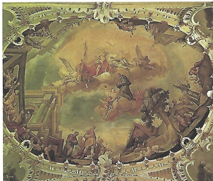
S. Linert representé te na cupola de nosta dlijia.