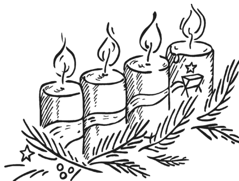
4. Advent: Dem Licht folgen