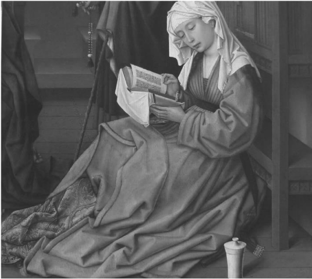
Rogier van der Weyden (1399–1464), Lesende Maria Magdalena