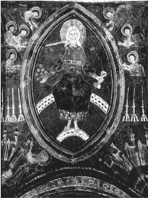
Fresko, Italien, 13. Jh.

Der Sport sei immer ein Mittel für Austausch und Wachstum, aber nie Anlass zu Hass und Gewalt.