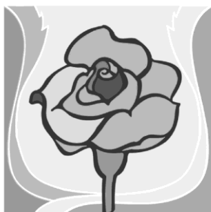
12. September: Mariä Namen