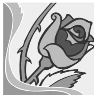
15. September: Mariä Schmerzen