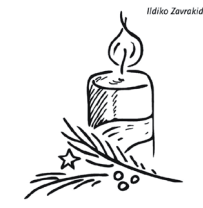
1. Advent: Die Umkehr wagen

N. B.: Düc i ministronc é entres begnodüs da gní a sorví, ince sce ai n'é nia scric sö!