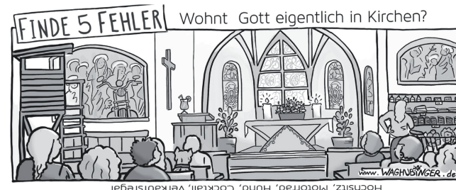
Hochstiz, Motorrad, Hund, Cocktail, Verkaufstregal

Meer und Fluss, Berg und Tal, Wald und Feld – in allem können wir Gottes Liebe finden.