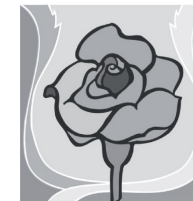
12. September: Mariä Namen