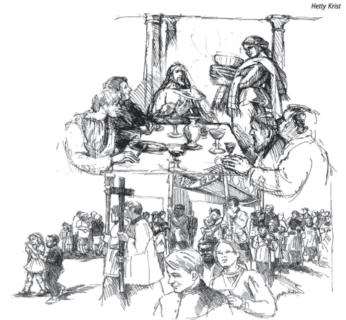
Das Evangelium berichtet vom Letzten Abendmahl Jesu mit seinen Jüngern am Gründonnerstag. An diesem Abend machte sich Jesus uns im Sakrament der Eucharistie zum Geschenk, doch die Freude darüber steht im Schatten des Karfreitags, im Schatten seines Leidens und Sterbens. Deshalb feiern wir seit dem frühen Mittelalter Fronleichnam, um unserer Freude über das Geschenk Gottes einen besonderen Ort zu geben.

Oh Signur, no se lascé susc, mo stá pa nos y scínchesse tres endò le pan dla vita. Con la forza de cösta spèisa formunse ennant la comunité de töa Dlijia dan dai edli de Chèl Bel Dio y dan dala jont. De cösc te periunse tal unité dal Spirit Sant. Amen.