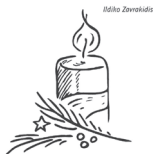
1. Advent: Die Umkehr wagen

N.B.: Oraziun d'Advënt te Familia – tles Families