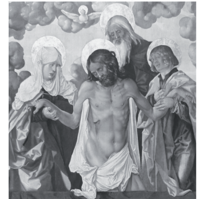
Hans Baldung Grien, Trinität und mystische Pieta, 1512

Das Bild erweckt den Eindruck einer doppelten Trinität. Einmal wie üblich Gottvater, Sohn und Heiliger Geist; die andere: die trauernden Maria und Johannes mit Jesus. Beides Mal steht der leidende und sterbende Jesus im Mittelpunkt. Seine Liebe, die bis in den Tod gegangen ist, ist der Schlüssel zum Verständnis der göttlichen Dreifaltigkeit. In ihr erfahren wir die ganze Fülle der Liebe Gottes – des Schöpfers, des Erlösers und des Beistands.